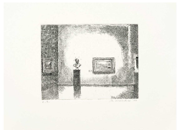
homeland 5 2010

Blatt: 77 x 94,4 cm; Motiv: 70 x 90 cm; Auflage: 12