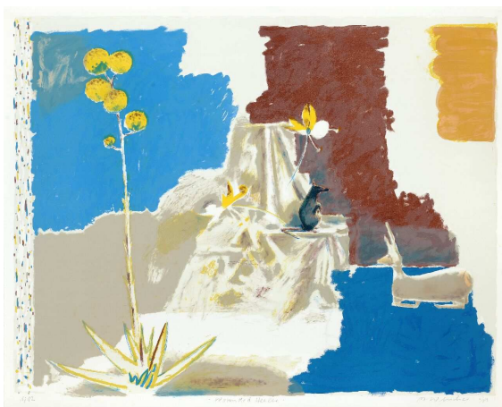
Wounded Healer 2011

Blatt: 75 x 62 cm; Motiv: 50 x 32,5 cm; Auflage: 12